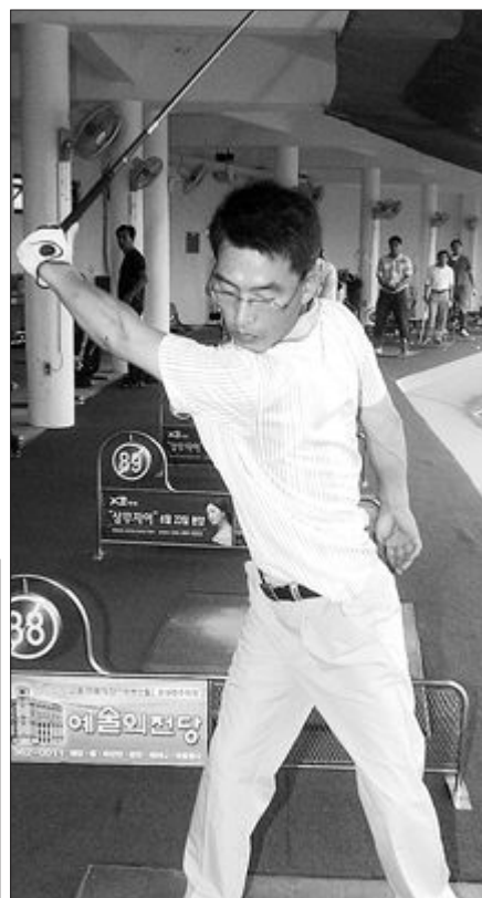
▲어깨 턴을 익히기 위한 왼손만으로 스윙연습.