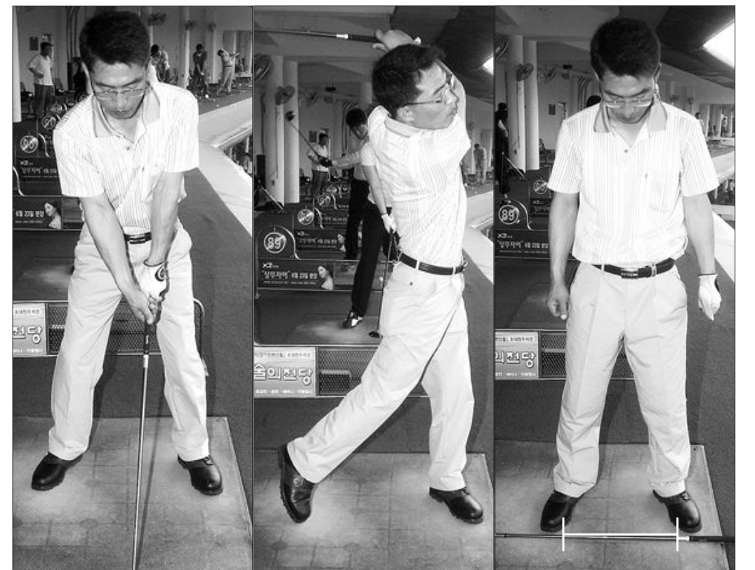
▲스탠스가 너무 넓어 체중이동이 이뤄지지 않는 잘못된 동작(왼쪽·가운데)과 자신의 어깨넓이의 적당한 스탠스(오른쪽).