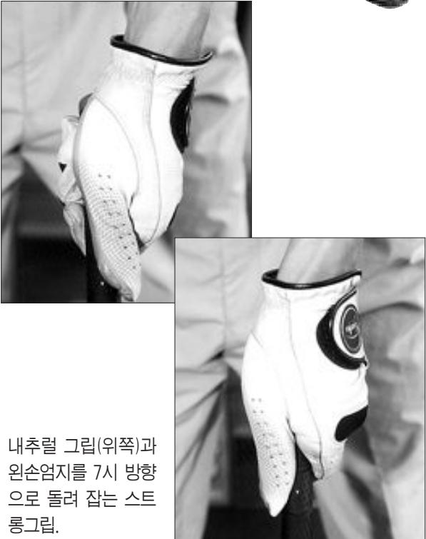
내추럴 그립(위쪽)과 왼손엄지를 7시 방향으로 돌려 잡는 스트롱그립.