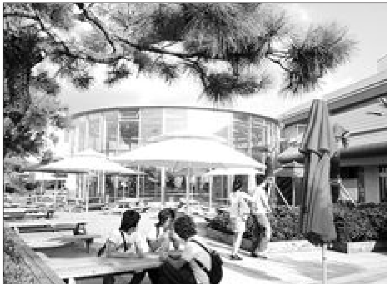
최근 새롭게 단장한 ‘유·스퀘어’에는 서점, 야외무대, 푸드코트 등 다양한 편의시설이 들어서 있다. 시민들의 휴식공간을 위해 2층 옥상에 조성된 테라스 존.

지난 10일 새로 개장한 ‘유·스퀘어’(U.Square·옛 광주종합고속버스터미널)는 다양한 편의시설을 갖춘 교통·문화·쇼핑의 중심지였다. 이용객들은 ‘유·스퀘어’의 입구에 들어설 때부터 색다른 시설을 볼 수 있었다. 지상 4곳·지하 2곳 등 모든 입구에 ‘에어커튼’(air curtain)이 설치돼 있는 것. 금호고속은 기존 시설이 병·난방 문제가 있다고 지적돼 실외의 공기가 실내로 들어오는 것을 막기 위해 ‘에어커튼’을 전면 설치했다. 관광안내소 오른쪽에는 초대형 서점(영풍문고)이 눈에 띈다. 700평의 이 서점에는 25만여권의 장서가 비치, 광주·전남 최고의 서점으로 떠올랐다. 서점 창문 너머로 보이는 독서 삼매경에 빠져있는 사람들의 모습은 광주가 ‘문화수도’임을 실감케 했다. 기존 하차지에 있던 음식점들은 한식·중식·양식·분식 등을 즐길 수 있는 ‘푸드코트’로 바뀌어 ‘식도락가’(食道樂家)의 발걸음이 이어졌다. ‘금호고속역사물전시장’에는 35년형 5인승 포드택시가 전시돼 바쁜 여행객들의 눈길을 끌었다. 그동안 일반인에게 공개되지 않았던 2층 옥상은 220평 규모의 녹지 공간으로 탈바꿈했다. 이용객들은 이곳에서 노정(路程)에 지친 심신을 달래고 있었다. 대합실 곳곳에 설치된 화단(5곳)에는 아자수·팔손이·호리우수 등 다양한 나무가 들어서 신비로운 분위기를 연출했다. ‘유·스퀘어’의 밖은 ‘젊은이들의 공간’이 됐다. 터미널 중앙부수대 인근에 들어선 야외무대에서는 각종 행사와 공연이 펼쳐질 예정이다. 금호고속은 조만간 연극·영화·무용·음악 등 모든 문화예술 장르의 공연과 관람이 가능한 복합문화센터도 건립할 계획이다. 긴편철 금호고속 이사는 “광주터미널은 이제 단순한 교통시설이 아닌 다양한 문화를 즐기는 공간”이라고 말했다. 한편 금호고속은 창사 60주년을 맞아 지난해 11월부터 250억원을 들여 광주시 서구 광천동 광주종합고속버스터미널을 전면 리모델링 하고, 명칭을 ‘유·스퀘어’로 바꾸었다. /이종태기자 jitee@kwangju.co.kr