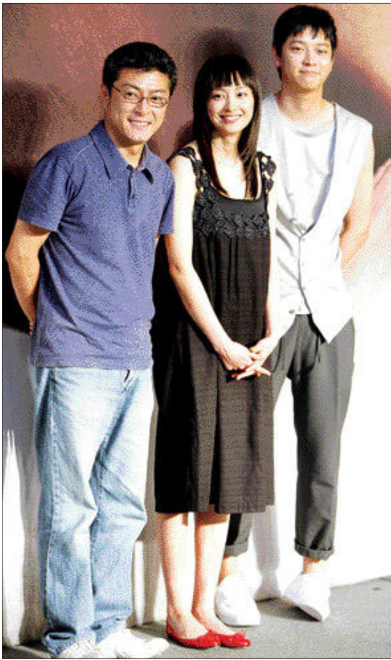
영화 '우리들의 행복한 시간'의 제작발표회에서 영화를 연출한 송해성감독(맨 왼쪽)과 주연배우인 이나영(가운데), 강동원이 포즈를 취하고 있다.