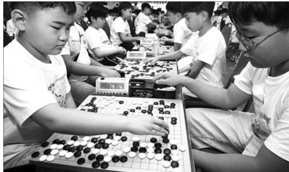
지난 8일 서울 여의도 63빌딩에서 열린 '제6회 대한생명배 세계 어린이 국수전'에서 바둑 꿈나무들이 치열한 예선경쟁을 벌이고 있다. /연영뉴스