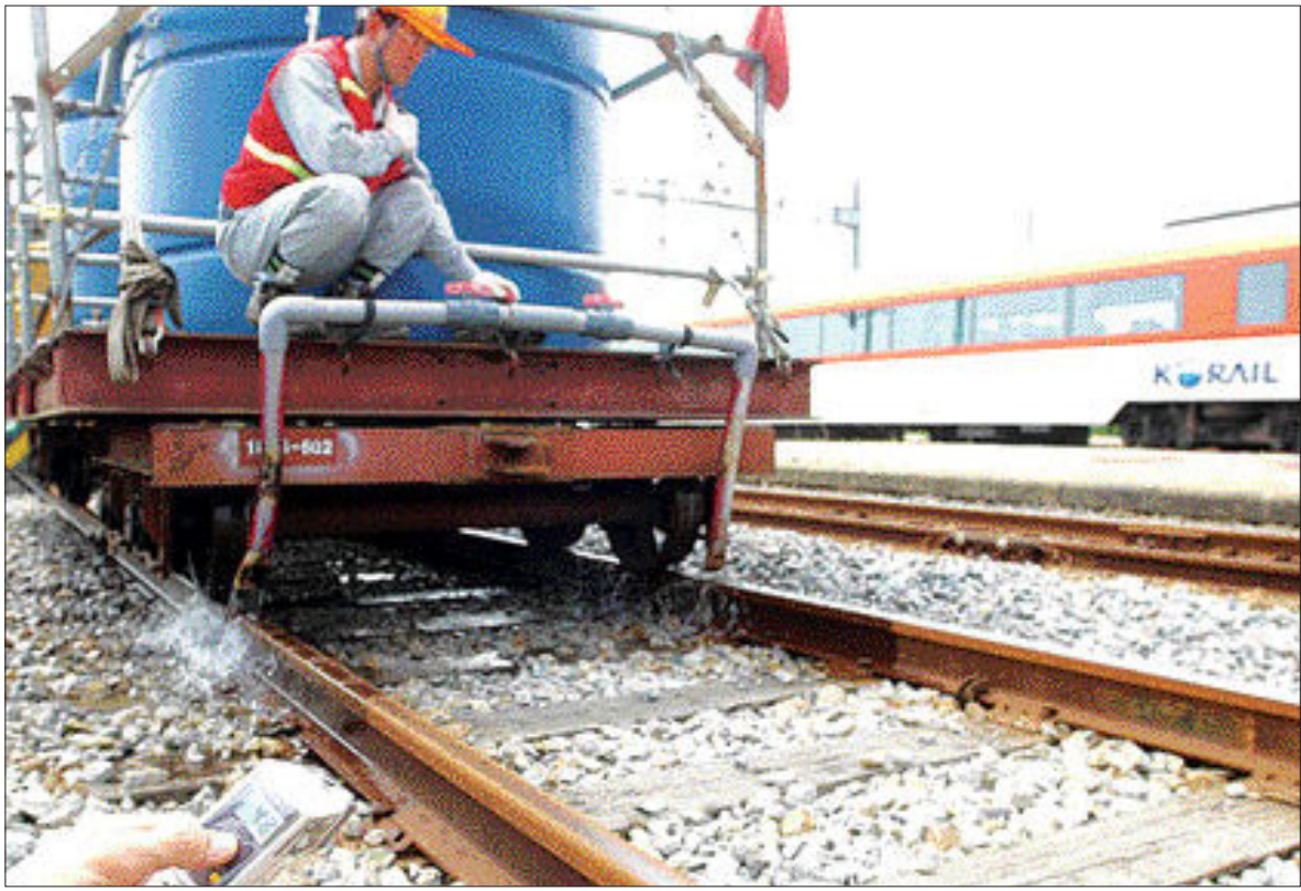
“철로를 식혀라” 연일 30도를 넘는 폭염이 계속되자 긴급 투입된 ‘평판화차’(平板貨車)가 호남선 광주 하남역 인근 레일에 물을 뿌리고 있다. 이 ‘평판화차’는 수온 17~20도의 지하수 등을 2천500ℓ 싣고 다니며 한번에 4km의 레일을 식힐 수 있다.