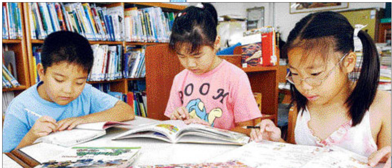
광주 사직도서관 어린이도서관을 찾은 초등학생들이 영어 동화책을 보며 독서심미성에 빠져 있다. 도서관에 비치된 영어 동화책을 적절하게 이용하면 아이들이 영어에 쉽게 다가갈 수 있다.

▶Dogsong=14살 에스키모 소년인 주인공은 개가 이끄는 썰매를 타고 얼음으로 뒤덮인 북극의 툰드라와 산맥을 여행한다. 1천400마일에 이르는 여행을 하면서 소년은 스스로 만든 노래 'Dogsong'을 흥얼거린다. 노래를 함께 부르며 소년의 탐험기를 따라가 보자.