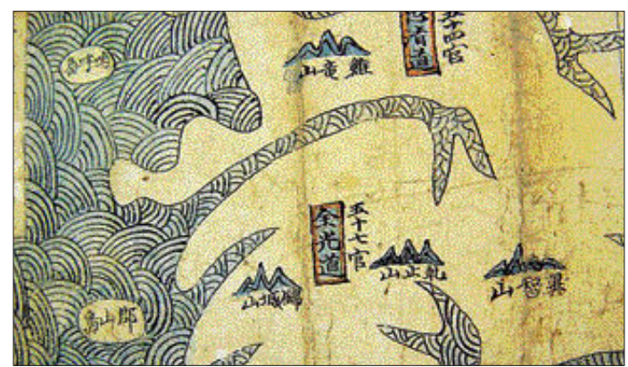
필도총도 여지도 중 전라도(1735년 나주를 금성현으로 강등, 전광도로 표기하고 있다)

고을마다 상징하고 지킴이 역할을 하는 산이 있다. 진산(鎭山)이라고는 별명도 있다. 남도를 대표하는 고장인 광주와 나주의 무등산(1천187m)과 금성산(452m)이 그 본보기다. 두 산은 중생대 백악기 말 화산활동으로 안산암, 유문암, 응회암이 굳어 형성됐다. 무등산은 호남정맥에 올라 영산강과 섬진강의 분수계를 이루고 있다. 그 모양이 무덤같이 '무덤산', 무수히 돌이 묻혀 있어 '무물산'이 한자로 옮겨질 때 불교사상과 연결되어 무등(無等)으로 표기됐다. 금성산은 장성 갈재(蓋嶺)에서 연결된 태청산으로부터 남쪽으로 치달러 나주평야에 우뚝 솟아올랐다. 그 높이가 무등과 견줄 수 없지만 주위가 한 눈에 들어와 산성(山城)이 설치되었다. 나주의 '나(羅)'자 즉 '비단'이 다른 한자로 옮겨져 금성(錦城)이 되었다.