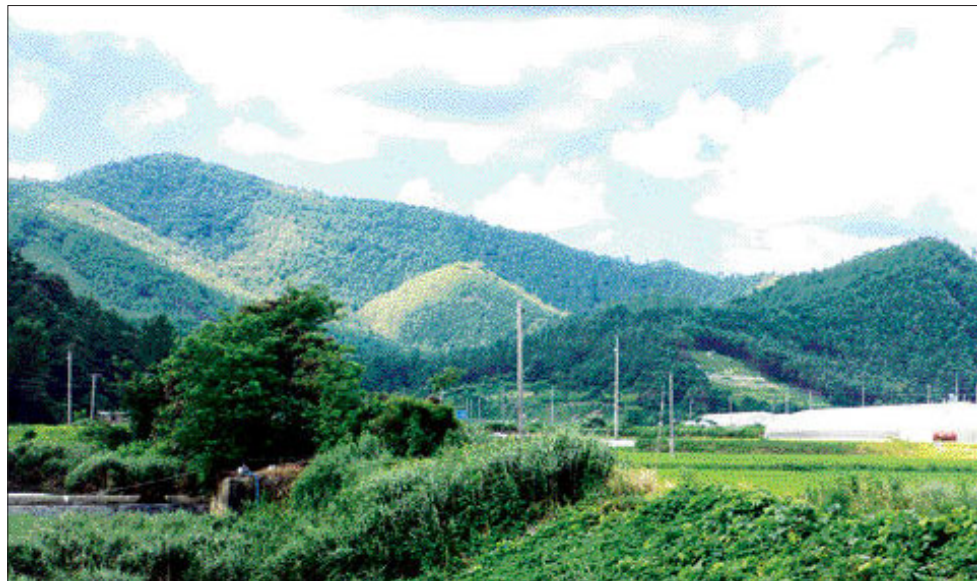
신광면 좌야리의 '야자혈'도(也字形). 이곳에 묘를 쓰면 모든 사람들이 우러러 보는 대학자와 성현이 태어난다는 명당이다.

억의 돈을 들여 묘를 썼다고 소문이 분분하기도 하지만, 그 어느 집안에서도 발복의 징후는 발견되지 않고 있으며, 잡초만 무성한 봉분들을 살펴볼 때 오히려 석각의 그림자만 짙게 드리워지고 있는 것으로 보여진다. 손불면 양재리의 모량 뒷산인 한세봉(漢世峰)의 갑묘풍(甲卯風)에 모란꽃이 반쯤 피어있는 모양의 모란반개형(牡丹半開形)이 있고, 그 뒤편에는 곤좌간향(坤坐間向)의 회룡고조형이 아직도 주인을 기다리고 있다.