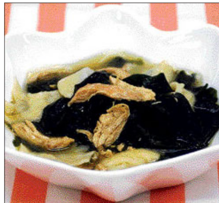
넙치 미역 수제비