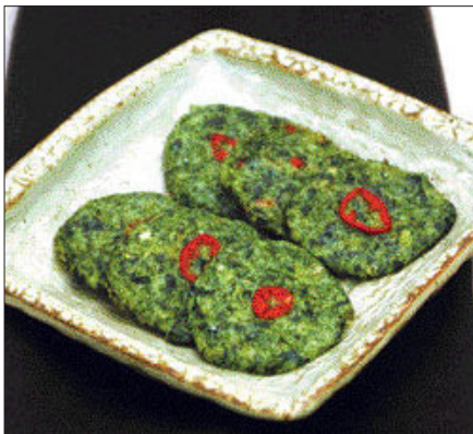
멸치 미역 줄기전