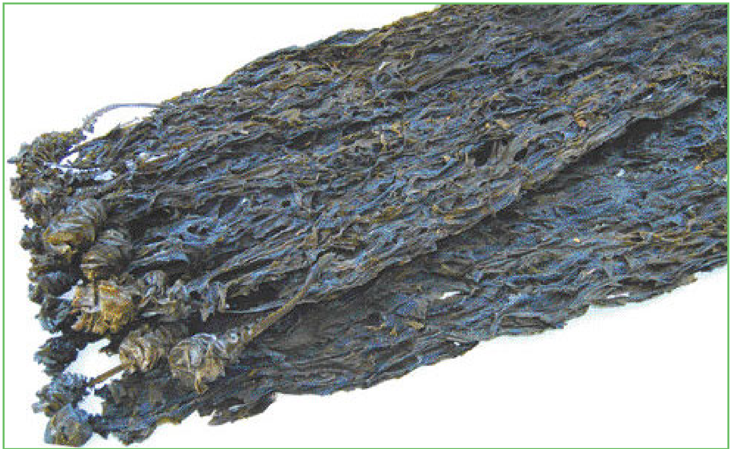
미역은 갈조식물 미역과의 한해살이 바닷말로 전북·소라의 주요 먹이며, 주로 우리나라, 일본, 중국 등지에서만 먹는 것으로 알려져 있다.

알긴산과 요오드의 역할 때문에 미역은 효과적인 다이어트 식품으로 꼽히기도 한다. 다