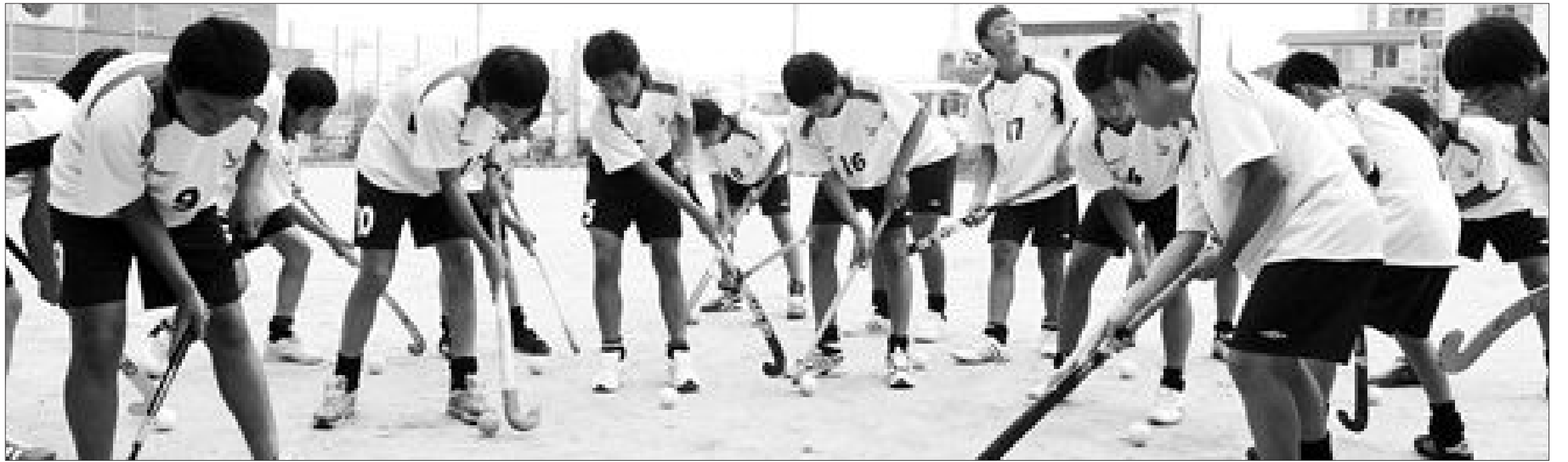
“공부도, 운동도 열심히”

이들 22명의 '선수'들은 불가능을 현실로 바꾸며 창단 3년만에 시즌 2관왕이라는 금자탑을 세웠다.