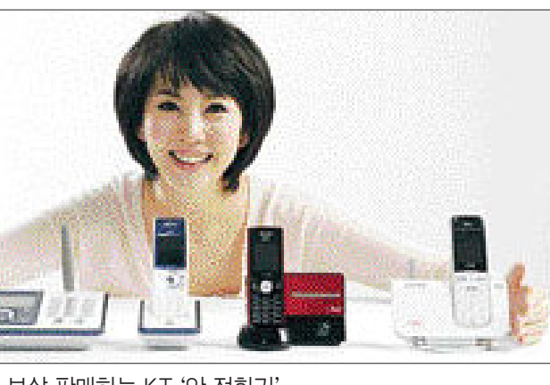
보상 판매하는 KT ‘안 전화기’.