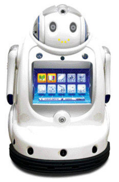
큐피드 (높이 45cm·무게 7kg)