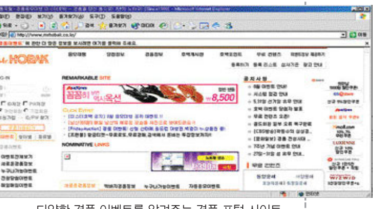
다양한 경품 이벤트를 알려주는 경품 포털 사이트.