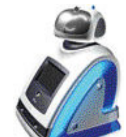
미르 (높이 55cm·무게 6kg)