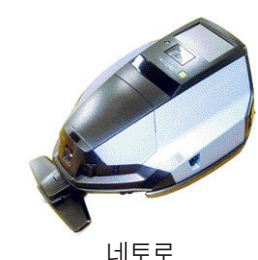
네토로 (높이 30cm·무게 15kg)