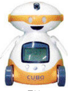
큐보 (높이 23.8cm·무게 1.2kg)

생돈을 내고 구입했다가 마음에 안들어 반품하려다 괜히 기본 상하는 경우 많다. ‘먼저 써보고 맘에 들면 살 수 있는 방법’, 넓혀 줬다. 잘못 활용하면 200만원짜리 최신행 로봇과 10만원짜리 전화기를 사용할 수 있다. 찾아라, 체험 이벤트. 아는 것이 돈이다. 공짜로 얻을 수 있는 것도 많다. 뭐니뭐니 해도 알뜰 구매를 통해 ‘머니’를 절약할 수 있다.