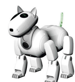
제니보 (높이 19.2cm·무게 1.1kg)

SMS를 공짜로 쓸 수 있다. 네이트온(nateon.nate.com)이나 SKT월드(www.sktworld.com)에 가입해도 월 100원이 무려다. 입산부들을 위한 이벤트도 많다. 남양유업의 남양아이(www.namyang.com)에 회원으로 가입하면 분유·기저귀 등을 받을 수 있다. /김지윤기자 dok2000@kwangju.co.kr