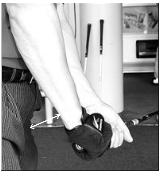
▲어프로치 다운스윙도 클럽 끝 부분부터 내려와야 정확하고 부드러운 타구감을 가질 수 있다.