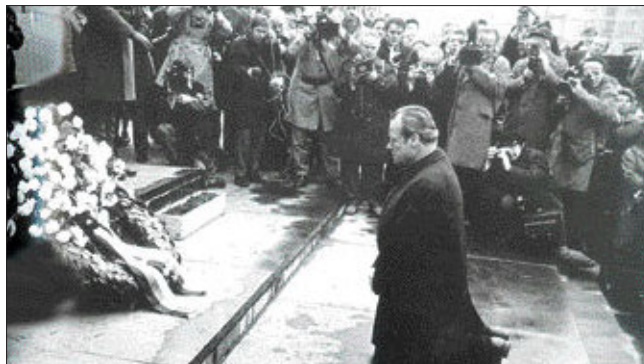
바르샤바 게토의 유대인 기념비 앞에서 무릎 꿇은 브란트 총리