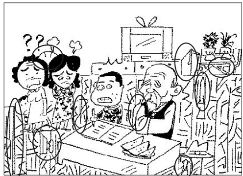
▲ 지난주 정답 송사리, 뭇, 다리미, 바늘, A자, 은행잎, 고추, 스폰, 펜촉