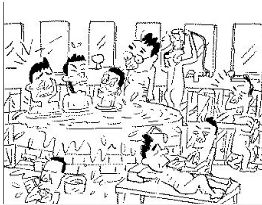
▲ (찾아) (보세) (요) 바늘, 펜촉, 음표, 피라미, 셔플룩, 성냥개비, 다리미, 뚝단배