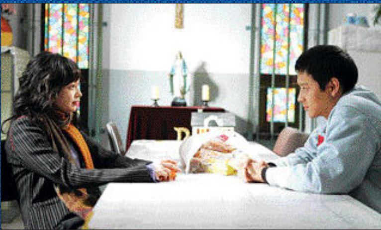
‘우리들의 행복한 시간’

‘우리들의 행복한 시간’ ‘오래된 정원’ ‘선학동 나그네’→‘천년학’ :