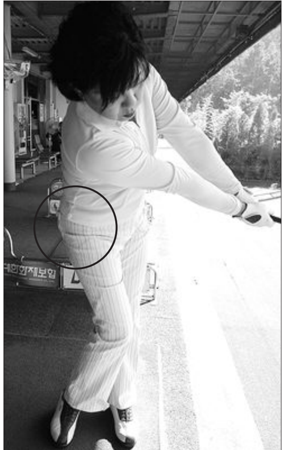
허리가 고정되고 어깨턴만으로 스윙하는 정확한 어프로치(위쪽)와 오른쪽 엉덩이가 돌아간 잘못된 어프로치 자세(아래쪽).