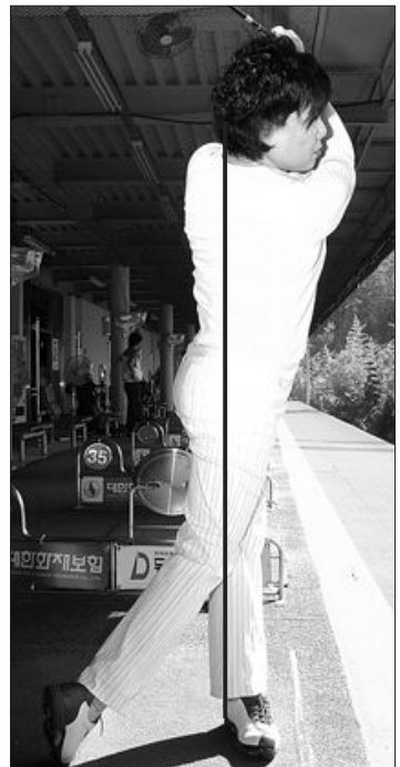
▲오른쪽 어깨가 왼쪽으로 쏠려 머리가 앞으로 나간 잘못된 동작(왼쪽)과 어깨 턴이 잘되고 머리가 스윙축 뒤에 남은 잘된 피니시 동작(오른쪽).