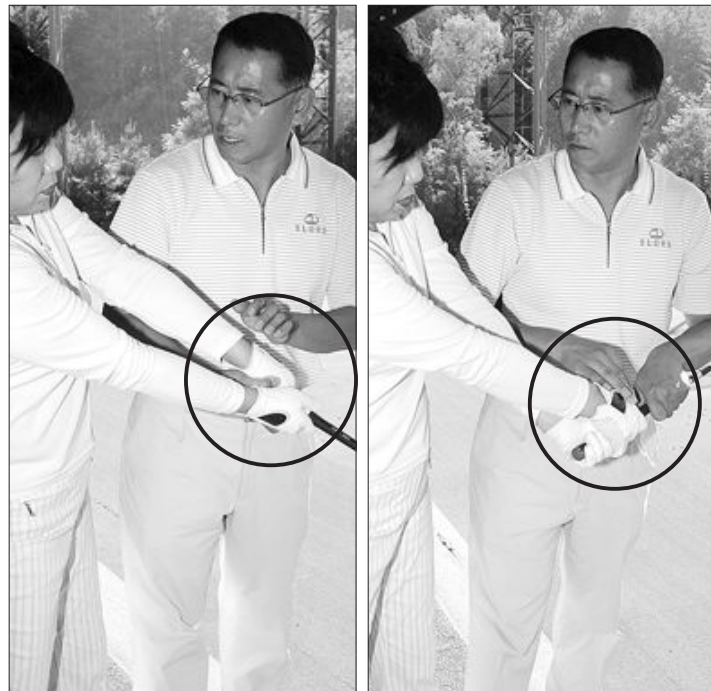
▲릴리스가 안되고 클럽을 밀고 있는 잘못된 스윙(왼쪽)과 정확한 릴리스 동작(오른쪽)