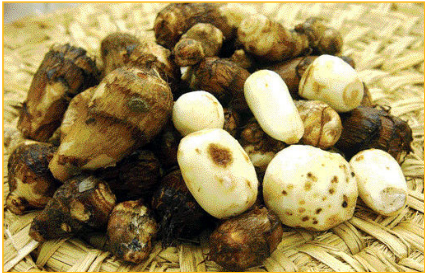
토란은 천남성과(天南星科)의 다년초로 열대 아시아가 원산지로 알려져 있다. 4월에 심어 7~9월에 수확하며, 우지(芋子) 또는 토련(土蓮)으로 부르기도 한다.

통증과 부기를 가라앉히는 데 도움을 주고 고됐기 때문에 치통이 심할 때 생강즙과 함께 섞어 환부에 바르기도 했다.