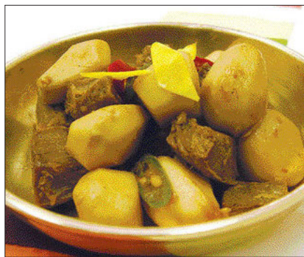
토란 쇠고기 조림