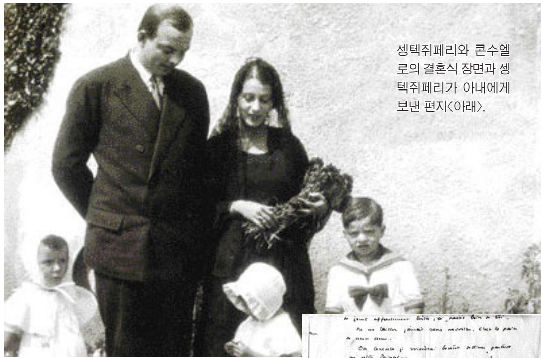
생텍쥐페리와 콘수엘로의 결혼식 장면과 생텍쥐페리가 아내에게 보낸 편지(아래).

1944년 2차 대전 중 정찰 비행을 나갔다가 홀연히 사라져 버린 그가 평생 동안 열정을 다해 사랑했던 것은 세 가지였다. 비행, 여자, 그리고 문학. 책에서는 그의 삶에 큰 축을 이루고 있는 이 세 가지에 대한 세