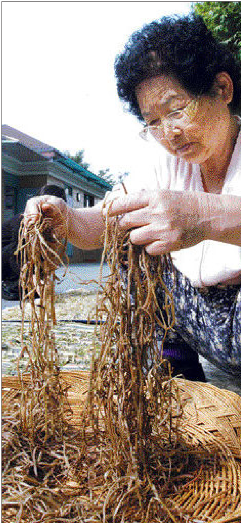
바람이 곁들여진 가을 햇살은 나물을 말리는 데 그만이다. 광주시 동구 운림동 라인 아파트 공동에서 한 주부가 토란대, 고구마순 등을 말리고 있다.

‘벌 좋은’ 가을 하늘이 계속되는 요즘이다. 한여름 피약벌과는 달리 그늘에서는 시원한 바람을 느낄 수도 있다. 이때이면 시골 마을 어귀에는 빨갭게 익은 고추를 말리는 모습을 심심찮게 볼 수 있다. 향수의 기억 때문일까. 아파트 베란다에는 야채를 말리는 주부들이 늘고 있다. 온순한 가을 햇살과 바람은 주부들에게 겨우내 ‘일용할 양식’이 될 나물을 말리라고 부추킨다. 말린 나물은 오래 두고 먹을 수 있을 뿐 아니라 쫄깃쫄깃한 맛을 느끼는 데도 제격이다. 벌이 좋기 때문에 올 추석 제사상에 올릴 나물을 말리기도 좋다.