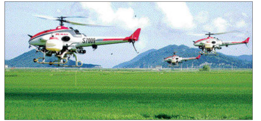
무인항공기 사업의 경우 농촌 고령화 가속에 따른 일손 부족 등을 겪는 광주·전남 지역에 활용하기 적합하다. 무인방제헬기 일본 아마하 RAMXL-17 II G.