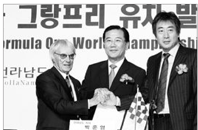
전남도는 2일 서울 웨스틴조선호텔 그랜드볼룸에서 KAVO와 공동으로 2010년 한국 F1 국제자동차경주대회 유치권 공식 발표하고 조인식을 가졌다. 협약서에 서명 후 기념촬영하고 있는 버니 에클레스톤 FOM회장(왼쪽), 박준영 지사(가운데), 정영조 KAVO대표.

지역별 기생충 검사결과를 보면 소양호에서는 2년간 3천920마리의 빙어를 잡아 기생충 검사를 했지만 단 1마리의 기생충도 검출되지 않았다. /최희중기자 chae@kwangju.co.kr