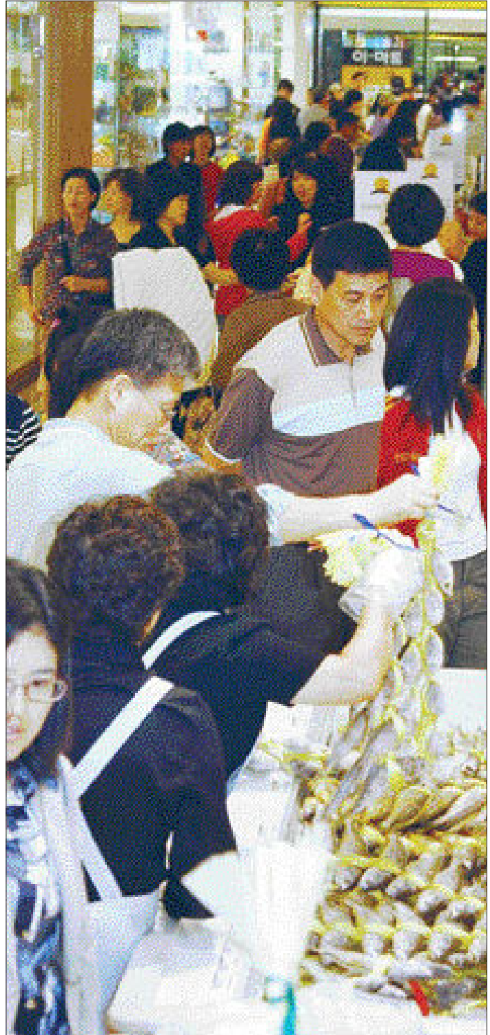
추석 선물구입 인파 북적 2일 광주신세계 백화점 등 광주 시내 백화점과 대형마트 등에는 추석 선물세트와 고리려는 먹거리 구매자들이 북적였다. 광주지역 유통업체들에서 추석 연휴기간동안 삼성 홀플러스만 휴무없이 영업을 하고 백화점들은 6~7일 이틀간, 대형마트는 6일 하루만 쉰다.