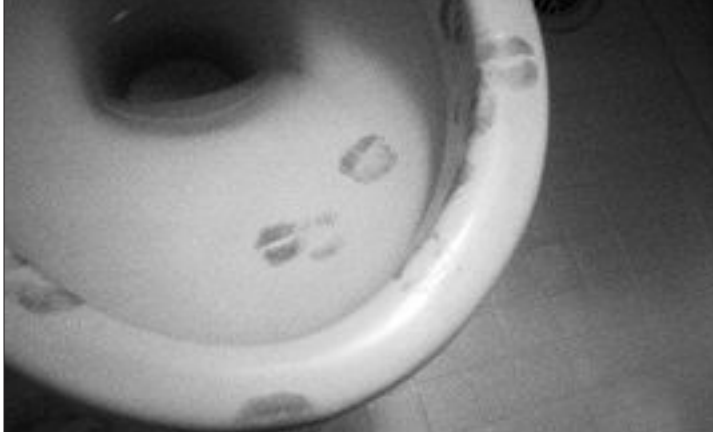
▲좌변기에 입술자국이? <유니텔톡>

6. 결혼하셨습니까? 그럼 삼계탕을 드셔야요! 벗고 누워있는 열계 위에 인삼·대추·밤 온갖 거시기에 좋은 계 다 들어있습니다. 특별한 밤을 보내십시오.