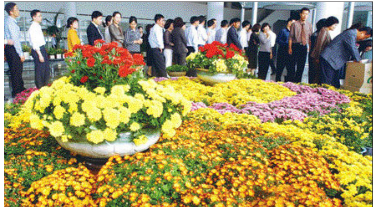
시청에 가면 가을꽃 향 그윽 전시한 이 행사는 13일까지 계속된다.

사가 부담키로 했다. 96억원을 투입하는 영주체육시설의 다목적 체육관은 체전중에는 핸드볼 경기장으로, 대회후에는 선수 훈련센터로 활용할 계획이다. 또 무등경기장, 영주수영장, 전남대학교 테니스장 50개 시설은 개보수하는 한편, 관리상태가 양호한 조선대 축구경기장 등 6개 시설은 그대로 사용한다. 아울러 사격, 사이클, 요트, 조정, 카누 등 6개 시설은 전남도가 개보수해 광주시가 무상 사용하도록 할 예정이다. 시는 총 사업비 277억원을 확보해 지난 8월부터 본격적인 공사에 들어갔다. 한편 광주시는 월드컵경기장에 4억원을 들여 성화대를 만들 계획이며, 성화 채화 장소로 강화도 마니산은 물론 무등산과 5·18묘지, 금강산 등을 검토하고 있다. /김주정기자 jinews@kwangju.co.kr