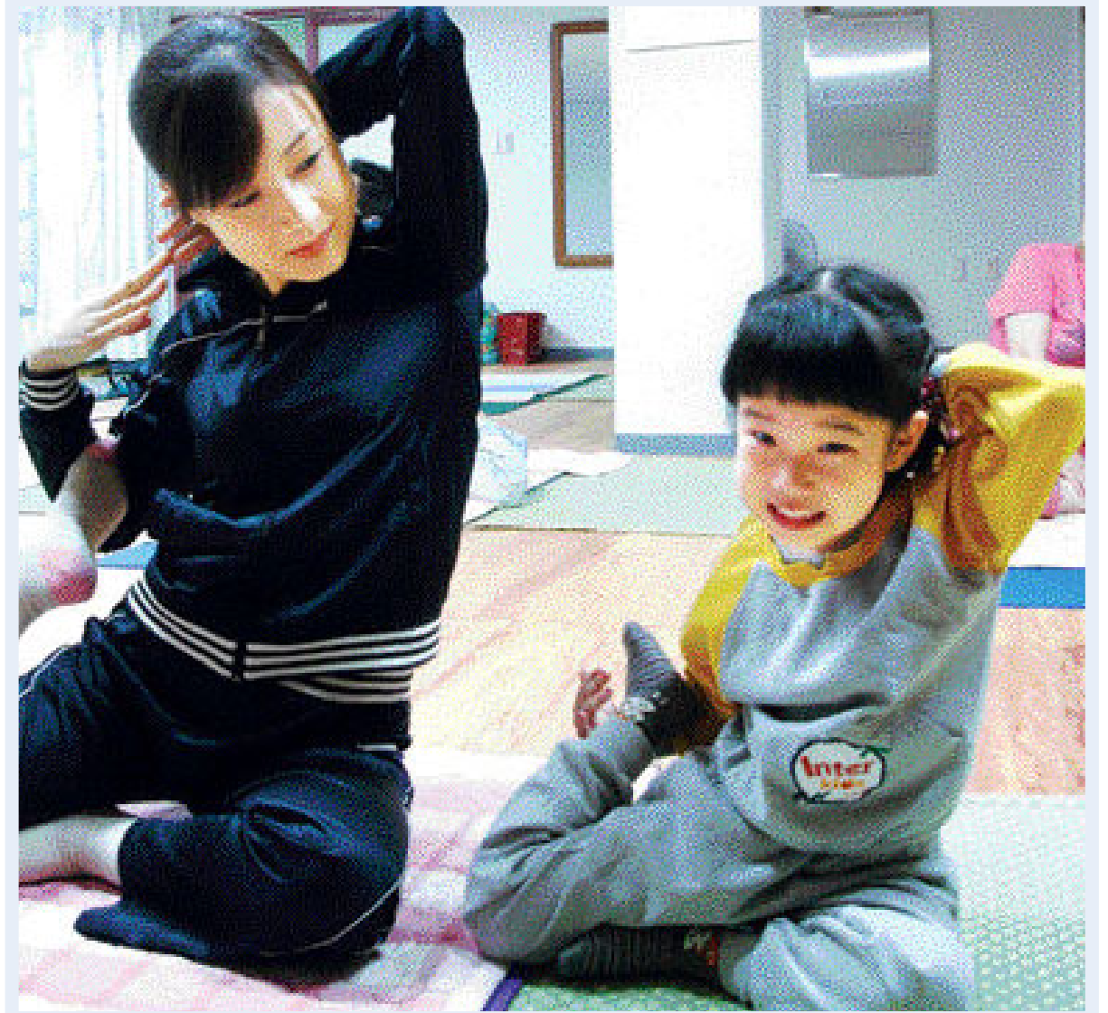
혼자서 하는 운동은 꾸준히 하기도 힘들 뿐더러 쉽게 흥미를 잃게 된다. 엄마와 아이가 함께 할 수 있는 요가를 통해 가족의 건강을 지키고 운동의 재미도 높아보자.