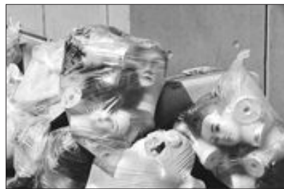
▶쓰레기 봉투 기절하겠네