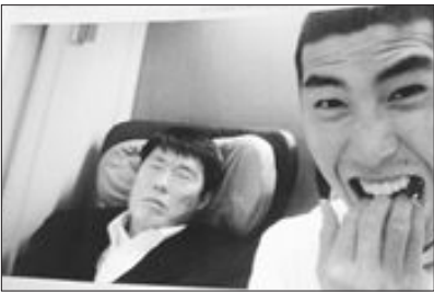
▲아빠한테 걸리면 죽는다