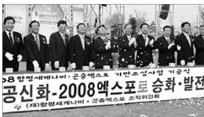
2008년 합평 나비·곤충엑스포 전시장 기공식이 19일 오전 이용섭 행정자치부장관, 추병직 건설교통부장관, 박준영 전남지사, 이석형 합평군수 등이 참석한 가운데 열렸다.

“2008 합평 세계나비·곤충 엑스포” 조성사업 및 합평생태하천복원사업 기공식이 19일 오전 이용섭 행정자치부장관과 추병직 건설교통부장관, 박준영 전남지사, 이석형 합평군수 등 내외 인사 1천여명이 참석한 가운데 합평역 엑스포공원 전지광장에서 열렸다.