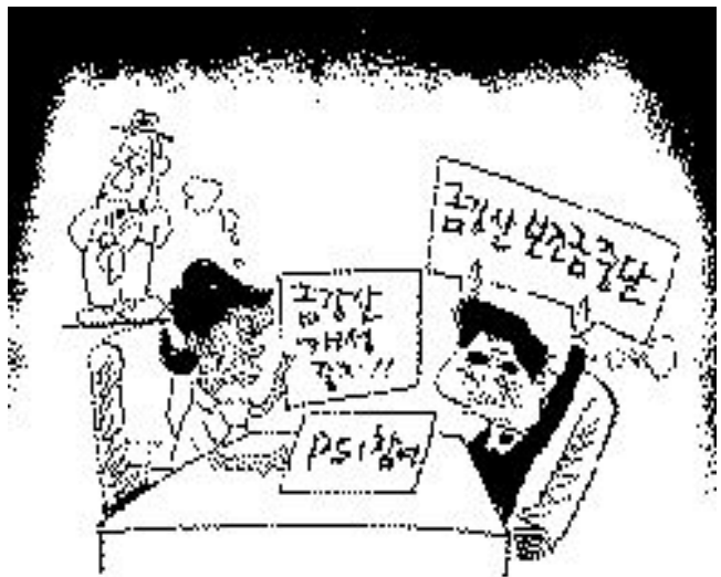
거의 東問西答 수준이군