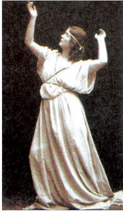
자연과 고대 그리스 예술에서 영감을 얻었던 현대무용가 이사도라 던킨.