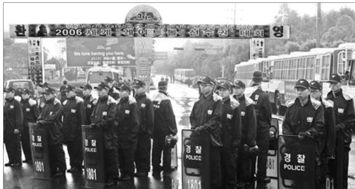
한미 FTA 4차 협상을 하루 앞둔 22일 오후 협상장인 서귀포시 신라호텔로 들어가는 중문관광단지 진입로를 전·의경들이 지키고 있다. /연합뉴스

도는 김 양식어민들로부터 물건을 구매해 가공 중인 김 가공공장 393개에 대한 면세유 공급이 올해부터 중단돼 어민과 가공공장 모두 어려움을 겪게 되자 정부에 면세유 공급제도를 개선해 줄 것을 요구했으며, 재경부는 모든 김 건조장에 면세유가 공급되도록 개정안을 검토중인 것으로 알려졌다. 전남의 김생산은 연간 6천3백만 톤으로 1천850여원의 소득을 올리고 있다. /박지경기자 unipark@kwangju.co.kr