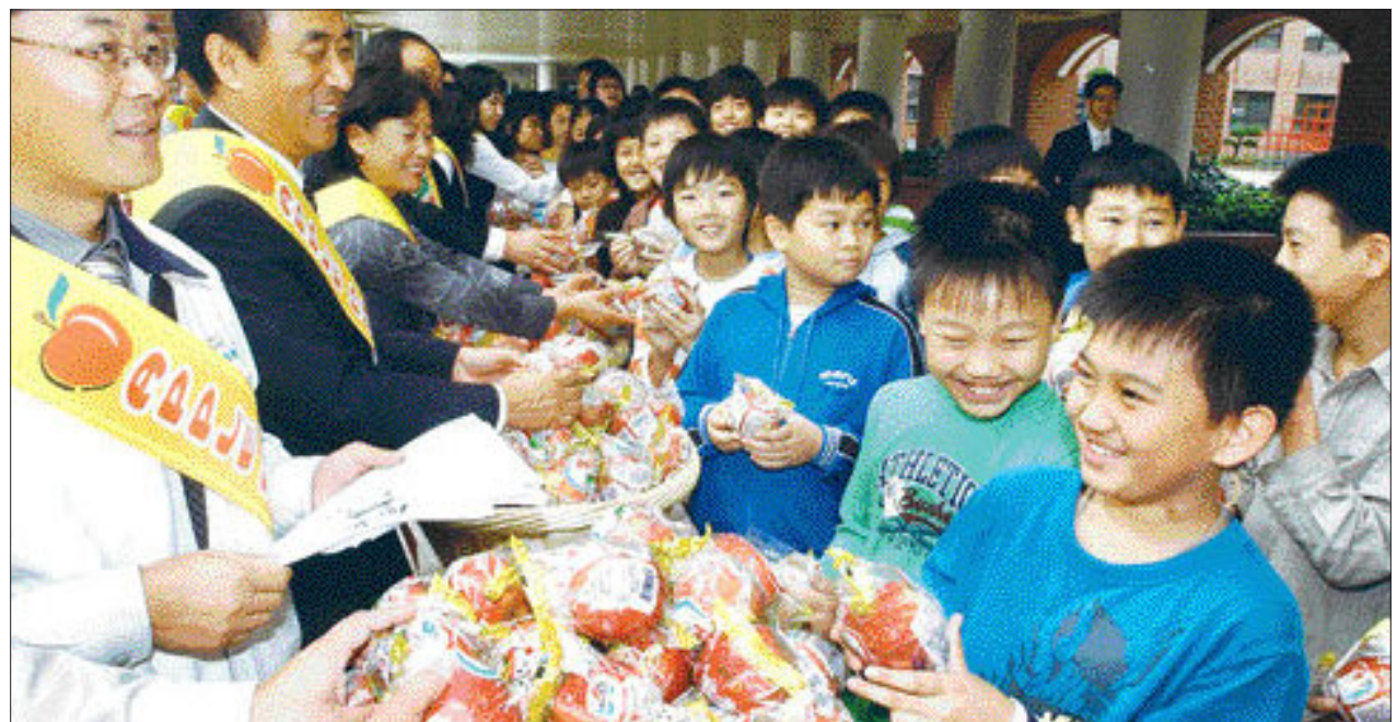
사과먹고 사랑과 용서의 마음을... 농협전남지역본부 직원들이 '사과데이(24일)'를 앞두고 23일 광산구 어등초등학교 어린이들에게 사과를 나눠주고 있다. '사과데이'는 '사랑과 용서의 마음을 전하자'는 뜻에서 5년전부터 시작했다.