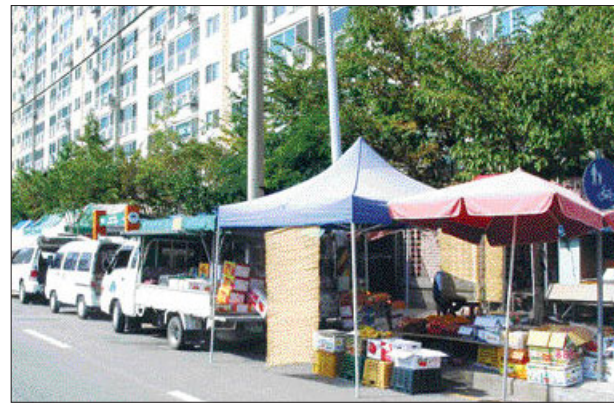
노점상들이 인도는 물론 차도까지 점유해 주민들의 민원이 끊이지 않고 있는 중동 호반아파트 앞 도로.