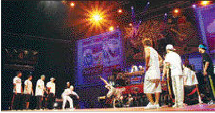
한국의 비보이팀 라스트포원 크루가 비보이(B-Boy)들의 월드컵으로 불리는 '배틀 오브 더 이어 2006'(Battle of The Year 2006)에서 준우승을 차지했다. (라스트포원 크루의 공연장면)