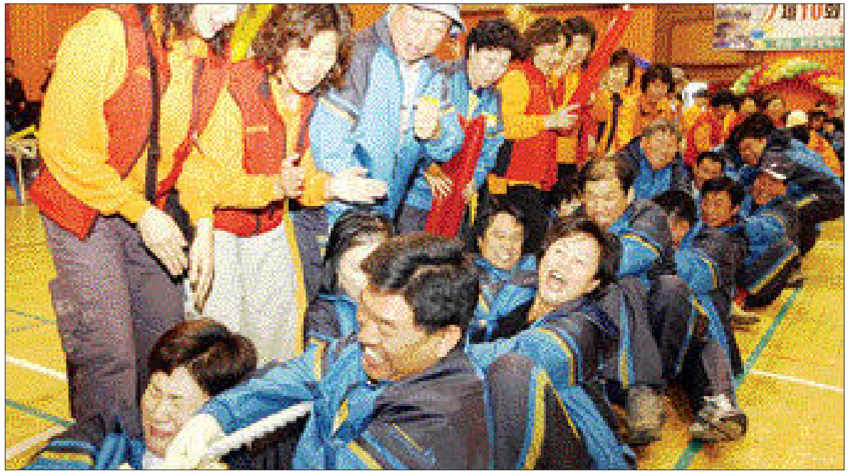
영·호남 장애인 친선교류대회 제10회 영·호남 장애인 친선교류대회가 25일 오전 광주장애인종합복지관 체육관에서 열렸다. 광주시 북구청과 대구 달서구청이 함께 하는 교류 대회는 광주 350여 명, 대구 150여 명 등 500여 명이 참가했다. 참가자들은 줄다리기 등 체육 대회와 비엔날레 관람, 국립 5·18민주묘지 참배 등의 행사를 함께 하며 우정을 다졌다.

주민들은 “적자때문에 여객선 취항이 어렵다면 국가나 지자체가 손익의 일정 부분을 보상하면 될 것”이라며 관계기관의 적극적인 대책 마련을 촉구했다. 한편, 지난 9월 기상청이 연도·손죽도·초도를 기상 예보구역 상 '남해 서부 먼 바다'에서 '야마다로'로 조정함에 따라 이 지역 주민 550여 세대 1400여명이 배 결항이 감소하는 등 주민불편이 크게 해소될 것으로 기대했었다.