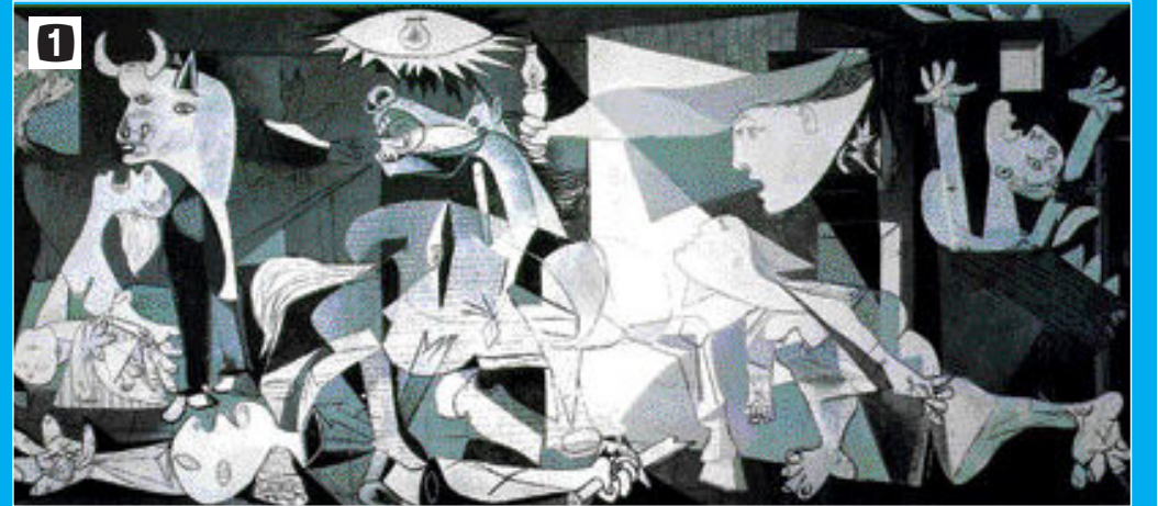
1 피카소-게르니카 2 벨라스케스-시녀들 3 미켈란젤로-모세상 4 마사치오-아담과 이브의 낙원추방