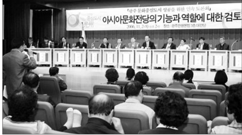
2일 오후 광주시 동구 대인동 광주은행 본점 대강당에서 열린 ‘아시아문화전당의 기능과 역할에 대한 검토’ 토론회가 갖게 인사와 시민 등 300여명이 참가한 가운데 열렸다.