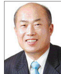
이에 따라 참여연대는 주민 자치의 올바른 정착을 위한 공적 회 개최, 지역 인재 육성을 위한 정책 세미나와 지역민의 복지 확립을 위한 정책포럼을 개최하게 된다. 이와함께 지방자치 지도자 육성, 주민을 위한 컴퓨터 한자 교실, 근로자와 노인 무료 취업 알선 등의 사업도 전개한다. 특히 참여연대는 전문분야 자문 위원단 15명을 비롯, 정책위원단을

주민자치 참여연대는 광주전남 지역 교수, 변호사, 각급 사회단체장 등이 주축이 돼 결성됐으며, 앞으로 3백여명의 이사장과 1만여 회원들이 주민자치 정착을 물론, 미래 지향적인 지역공동체 형성을 위한 다양한 사업을 전개하게 된다.