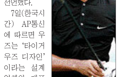
7일(한국시간) AP통신에 따르면 우즈는 ‘타이거 우즈 디자인’이라는 설계업체의 대표로 취임해 골프 코스 부지 선정 작업을 조만간 벌여 나갈 계획이다.

‘골프 황제’ 타이거 우즈(미국)가 골프코스 설계 사업 진출을 선언했다.