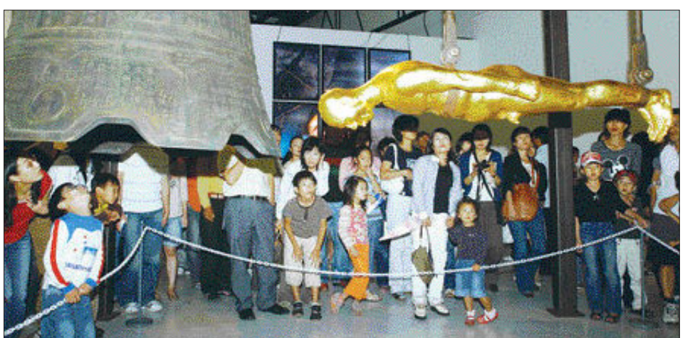
오는 11일 폐막을 앞두고 있는 2006광주비엔날레는 주제중심 전시, 시민참여프로그램 도입, 일회성 축제 프로그램 대폭 축소 등을 통해 전시문화의 가능성을 열었다는 평가를 받았다.