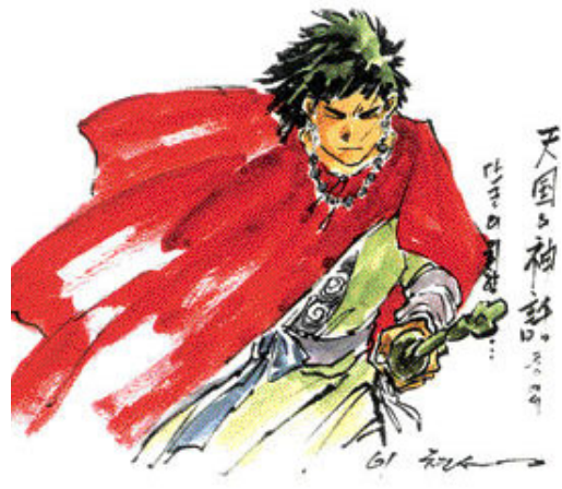
만화가 이현세의 분신과도 같은 '까치'