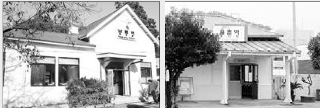
신도청 건물과 야외광장. 왼쪽은 로비, 오른쪽은 야외광장. (사진: 전남도청 제공)

설명했다. 현재는 지역별로 다른 교통카드를 사용하고 있어 여러 지역에서 이용하기 위해서는 지역별 교통카드를 모두 갖고 있어야 하는 번거로움이 있다. 기술표준원은 국가표준이 도입되면 교통카드 사업자들은 지역별로 다른 카드를 만들기 위한 중복투자를 피할 수 있고 소비자들은 한 장의 카드로 전국 어디에서나 사용할 수 있다고 말했다. /연합뉴스