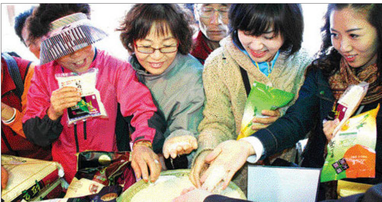
“미질 좋은 전남쌀 맛 최고”

주택금융공사 광주지사 관계자는 "주택 사업자들이 광주 수완지구 등 대규모 택지개발을 중심으로 아파트를 공급하면서 타 지역에 비해 금융권 대출을 많이 이용했다"며 "개인들은 주택물량이 늘었지만 최근 집값 상승에 불안감을 느껴 서둘러 내집마련에 나선 것 같다"고 말했다. /정필수기자 bungy@kwangju.co.kr