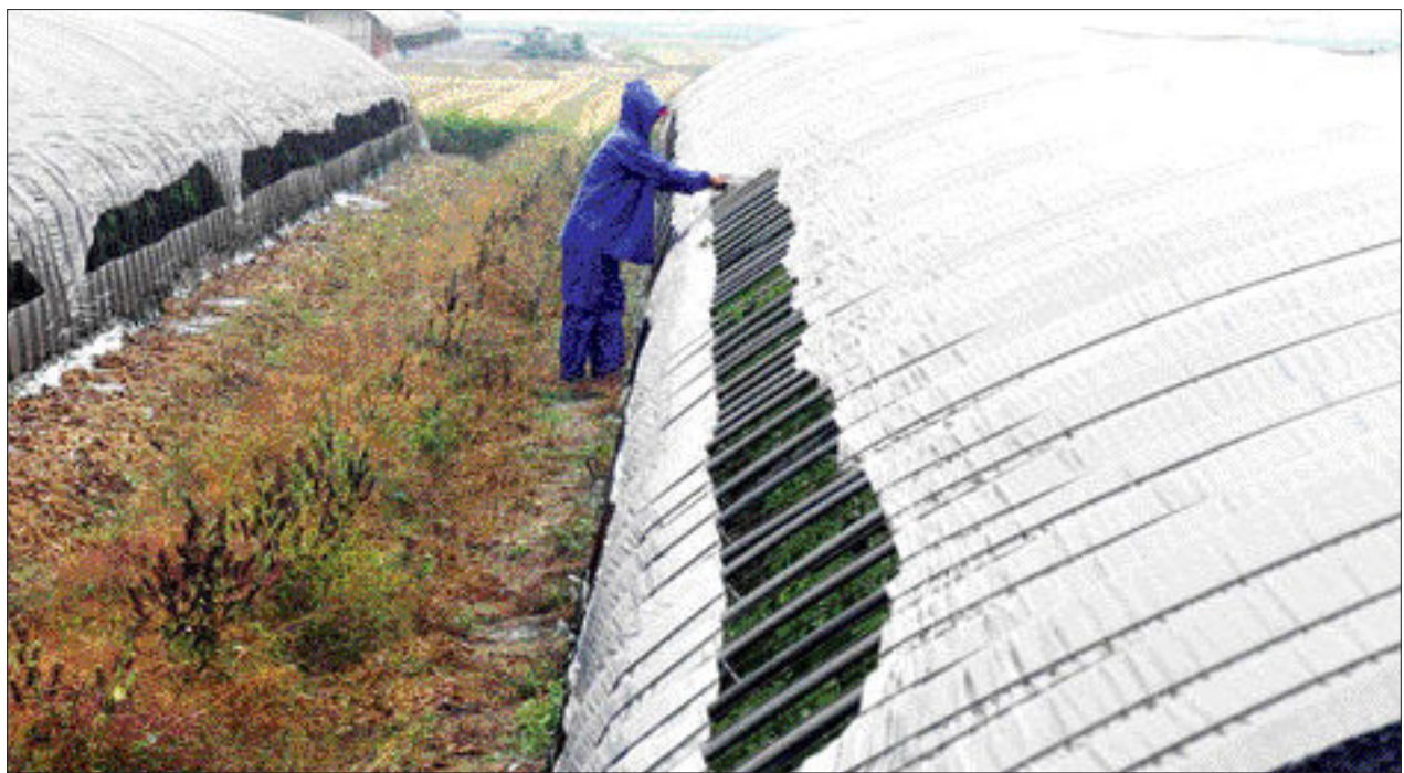
겨울 단비... 손길 분주한 농민 스 손질에 여념이 없다.