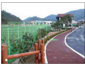
군외면 불목리에 해신축구장 1면과 완도중학교 운동장을 인조잔디구장으로 만들 계획이다.