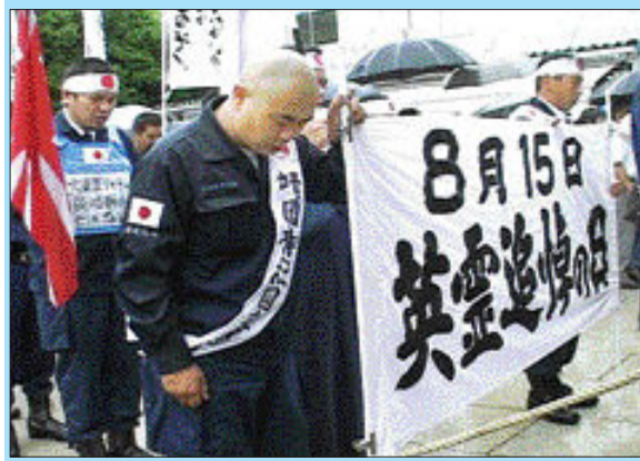
개막작 '안녕, 사요나라'