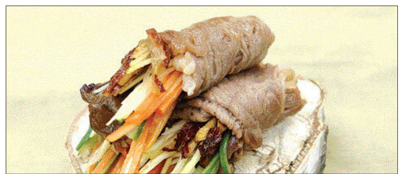
(도움 주신 분=김지현 요리학원 진미연 연구원·푸드스타일리스트 김나영)