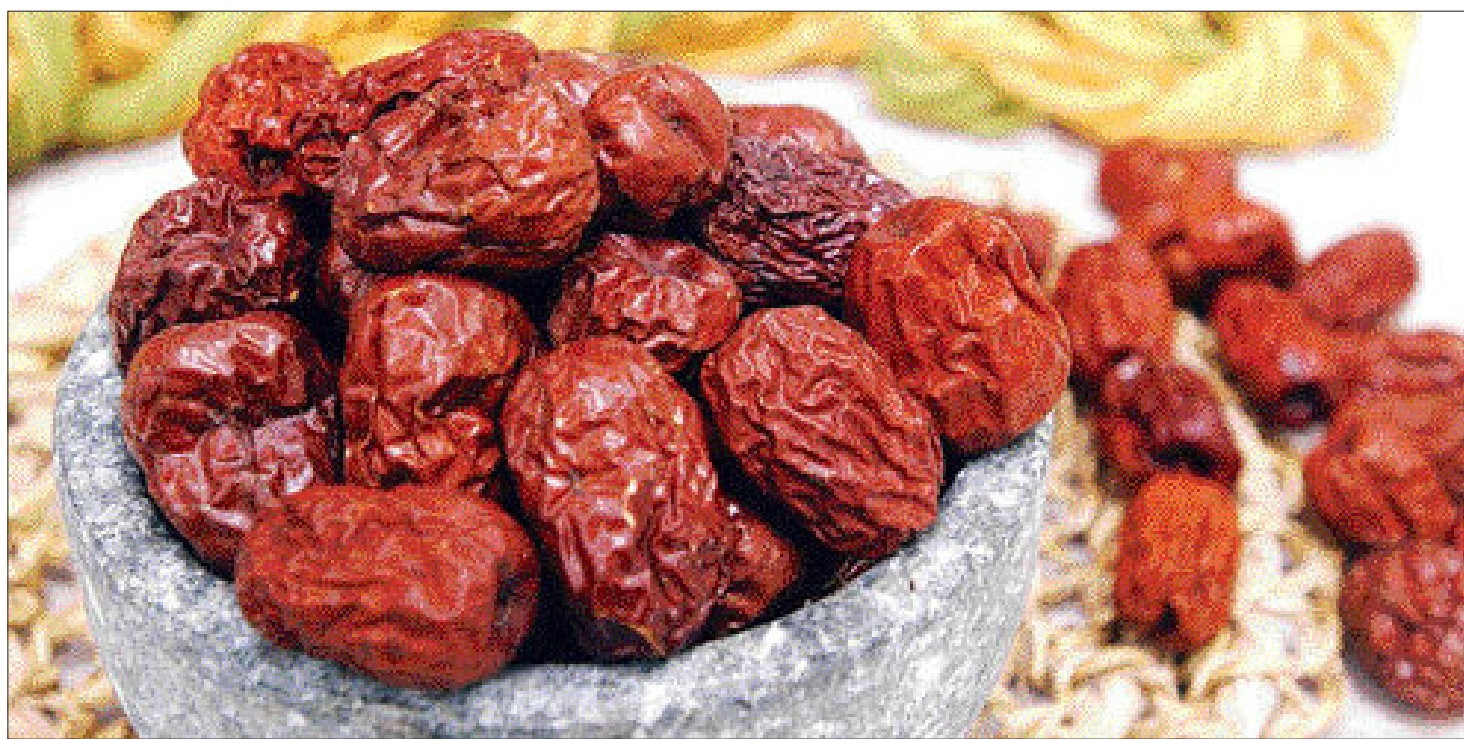
대추는 갈매나무과 낙엽교목인 대추나무의 열매다. 대추나무는 유럽 동남부와 아시아 동남부가 원산지다. 한방에서는 햇볕에 말린 가을 대추를 대조(大棗)라 부른다.