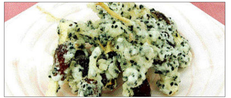
▲인삼대추튀김=(재료)수삼 1뿌리, 대추 6개, 식용유, 튀김가루 1/2컵, 물 1/2컵, 감자개 1종 (만드는 법)①수삼을 6cm 길이로 약간 굵게 채썰고, 대추는 씻은 행주로 닦아 돌려 깎는다 ②대추를 수삼과 함께 돌돌 만든다 ③튀김 반죽을 만든다 ④수삼을 말은 대추를 튀긴다.