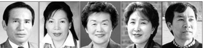
<염광옥씨> <김다경씨> <임침자씨> <서향숙씨> <이태건씨>

송승헌의 일본 방문 팬미팅이 2천 대 1의 경쟁률을 보이고 있다. 5일자 일본 산케이스포츠는 “12일 일본을 첫 방문하는 송승헌의 후지TV 공개 일본 방문회견에 참가하기 위한 신청이 쇄도하고 있다”고 보도했다. 후지TV 본사에 이루어지는 공개 회견은 송승헌을 일본 현지에서 가장 먼저 볼 수 있는 자리로 후지TV는 추첨을 통해 일반 팬 100명만을 이 자리에 초대하기로 했다. 후지TV 측은 이를 위해 지난달 27일 오후 3시부터 공식 홈페이지를 통해 참가 신청을 받았으며 마감일 4일까지 20만 건 이상의 접속이 쇄도해 2천 대 1의 경쟁률을 보였다”고 전했다. 송승헌의 첫 일본 방문은 일본 후지TV에서 주최하는 대형 이벤트 ‘HOT 판타지 오디야바 2006-2007’의 게스트로 초대되면서 이뤄졌다. 이번 행사는 9일부터 내년 1월3일까지 열리는 대형 겨울 이벤트로, 송승헌 주연의 드라마 ‘가을 동화’ ‘여름 향기’ 등의 스틸사진이나 소품, 촬영 의상 등을 전시하는 ‘송승헌 코너’도 만들어진다.