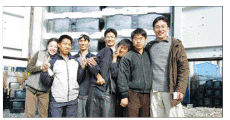
장애인 재활 자립기업 ‘일터’ 직원들이 인도네시아 첫 수출을 기념해 컨테이너 앞에서 자원봉사자들과 함께 기념촬영을 하고 있다.

22일 우수 법인의 이사 4명과 감사 2명에 대해 해임명령을 내리면서 일단락 되는 것으로 보였으나, 법원이 광주지방법원에 제출한 임원해임명령취소 및 효력정지 가처분 신청이 받아들여지면서 법정 공방으로 치닫고 있다. 현재 광산구청 앞에서 벌이고 있는 대책위의 천막농성은 6일로 205일째를 맞았다. 윤 집행위원장은 “인화 학교 문제는 단순한 성폭력 문제가 아니라 우리 사회의 장애인을 보는 시각을 알려주는 사건”이라며 “장애인에 대한 사회적 인 이해가 필요하다”고 강조했다. “법인이 사회적인 책임을 공감하고, 함께 해결할 의지를 보이는 것도 시급한 일이지만 시민들의 인식 전환도 중요하합니다. 장애인을 시혜나 보호의 대상으로 보는 것에서 벗어나 ‘함께 살아갈 방법’에 대해 고민해야 합니다.” /곽선정기자 ks@kwangju.co.kr