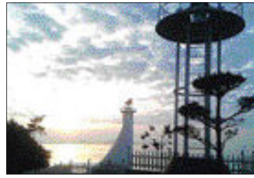
해남 화원면 목포구등대.

서남단 가거도에 위치한 소죽산도 등대와 영화 '그 섬에 가고 싶다'의 촬영지로 유명한 완도 소안면 당사도등대도 빼어난 자연경관과 다양한 동식물 서식처로 추천됐다.