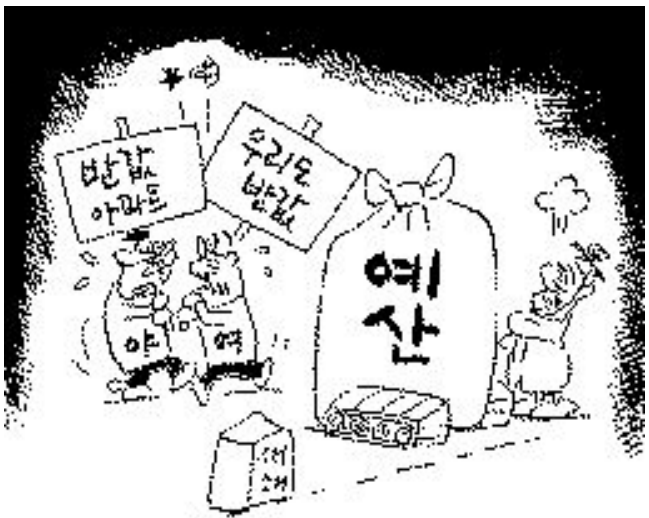
'밥값'부터 먼저 할일이다