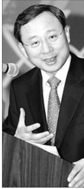
삼성전자 회장인 노홍필이 지난 11일(현지시간) 샌프란시스코 힐튼호텔에서 열린 2006 IEDM 반도체 학회에서 기조 연설을 하고 있다.

모바일 D램·S램을 하나의 D램으로 대체 CPU간 데이터처리속도 기존의 5배 단축 황창규 사장 "미래 IT 퓨전반도체가 선도"