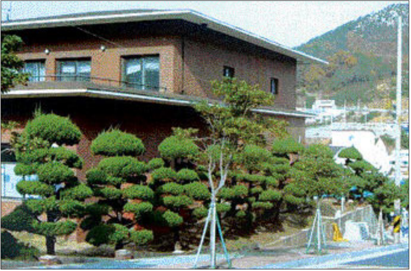
담장 대신 향나무 관광공사 주택단지 등의 담을 허물고 그 자리에 꽃과 나무를 심는 작업이 여수시내 곳곳에서 진행 중이다. 사진은 콘크리트 담장을 허물고 향나무를 심어 산뜻하게 변신한 안산동 LG화학 도원주택단지. /여수=박양규기자 ykpark@

엑스포 유치 가능성을 묻는 질문에는 '확실히 유치된다'와 '유치될 것으로 본다'고 답한 사람이 각각 응답자의 5.8%, 43.4%로 절반 수준인 49.2%가 긍정적인 의견을 표했다. 반면 '유치가 어렵다'와 '불확실하다'는 각각 6.8%와 24.6%로 나타났다. 31.4%가 유치 가능성에 대해 부정적인 견해를 갖고 있는 것으로 조사됐다. 한편 광양만권 통합에 대해서는 '주민투표로 통합 여부를 결정한다'가 42.5%로 가장 높았고 '통합할 수 있는 일을 먼저 추진한다'가 39.5%, '특별자치단체를 만들어 행정을 집행한다'가 9.6%로 나타났다. 이와 함께 논란이 되고 있는 통합정사 문제와 관련해서는 '광양만권 통합상황을 고려해 검토한다'가 40.8%, '통합정사를 지어야 한다' 23.7%, '지금 그대로 운영한다' 15.5%, '돌산정사로 통합한다' 12%순으로 조사됐다. 이번 여론조사의 오차 한계는 95%신뢰수준에서 ±2.1%포인트다. /여수=박양규기자 ykpark@