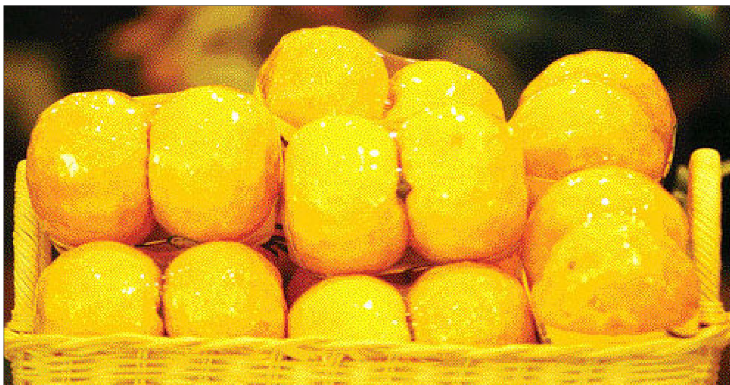
유자는 중국이 원산지인 국내에는 신라 때 장보고가 당나라 상인에게 얻어와 보급됐다고 한다. 전남 고흥과 경남 거제가 대표적인 생산지다.