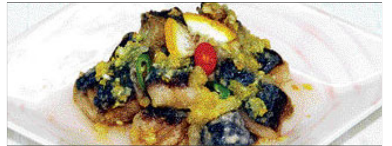
▲유자소스 삼치구이=(만드는 법) ①뼈를 제거하고 삼치를 손질해 5cm 크기로 썬다 ②①의 삼치에 소금과 후춧가루를 뿌려 간한다 ③삼치를 팬에 노릇하게 굽는다 ④꽃고추, 홍고추는 반으로 잘라 2cm 길이로 가늘게 채 썬다 ⑤유자소스를 만든다 ⑥구운 삼치에 유자소스를 뿌린 뒤 달걀지단과 고추채를 올린다.

/윤영기기자 penfoot@kwangju.co.kr