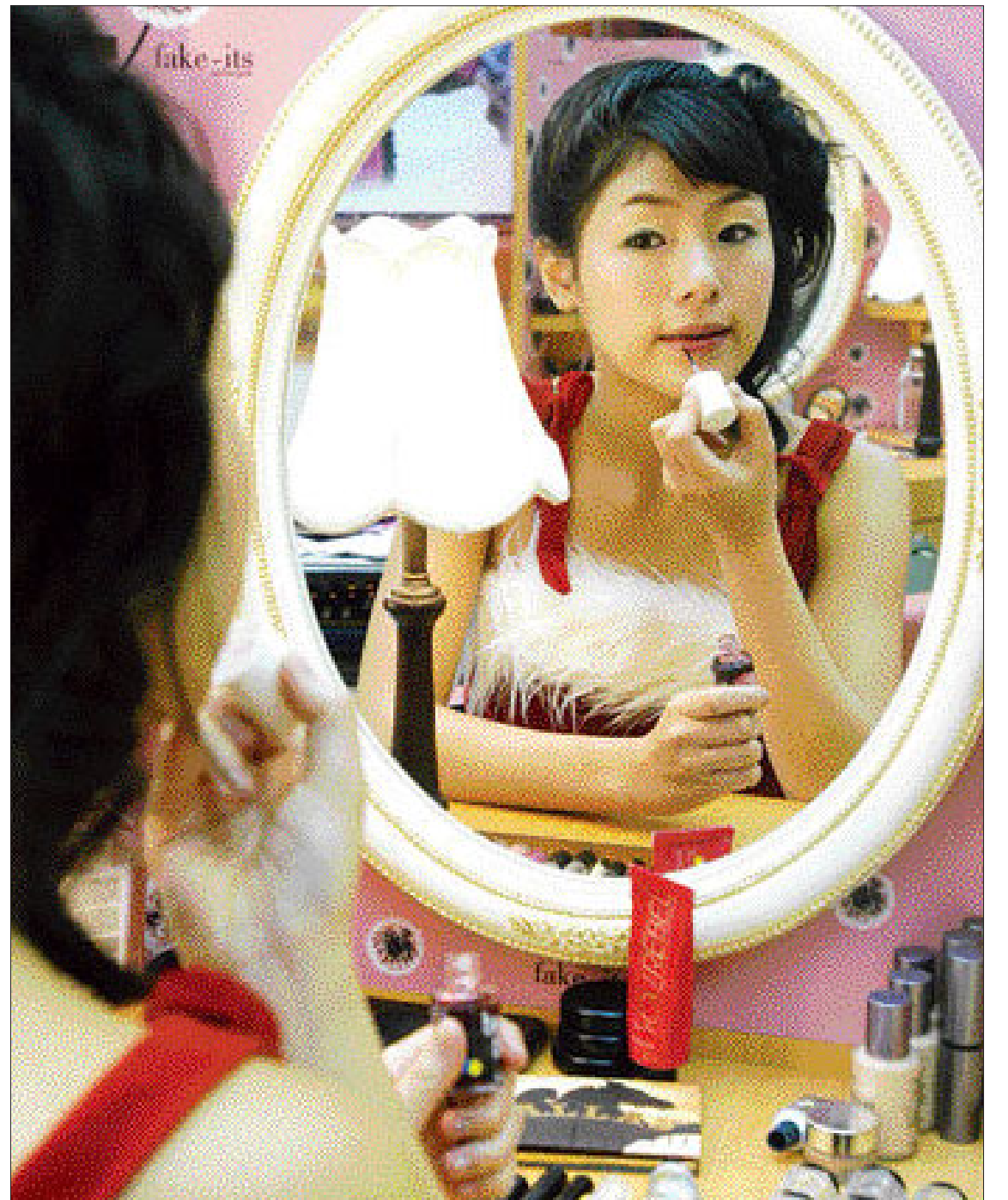
이번 연말 파티에서는 '스모키 메이크업'을 통해 사람들의 시선을 끌어보자. 그윽하고 매력적인 눈매로 '파티퀸'이 될 수 있다.