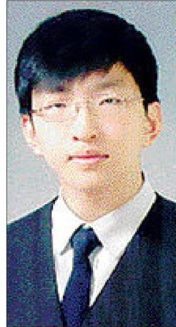
"친구들과 노력한 보람 찾게 돼 기뻐요"

선생님의 권유로 전남도 과학전람회에 출품한 것을 계기로 과학과 인연을 맺게 된다. 5학년때는 순천교육청 영재교실에서 공부하며 전남발명품대회에서 은상을 수상했고, 6학년때 순천교육청 영재교육원에서 영재교육을 받게 된다. 연향중에 진학한 김 군은 2학년때부터 순천대학교 영재교육원에서 한달에 한 번 지도를 받고 있다.