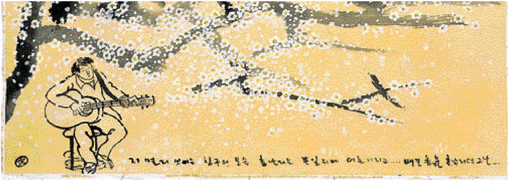
상처 많은 70년대 학번에게 여전한 그리움으로 남아있는 가수 김민기를 추억하며 저자가 그린 '시절은 가고 노래만 남아'.